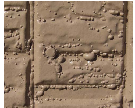
塗装メンテナンス=失敗例(左:目地深さ不足目地シール切れ 中:吸水のはくり 右:直張り塗膜のフクレ)