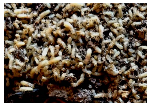
雨漏りサイディング材下地木部の腐朽 とやまとしろあり(右)