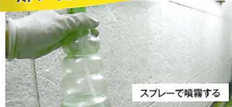
スプレーで噴霧する