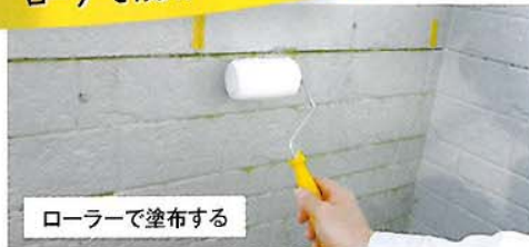
ローラーで塗布する