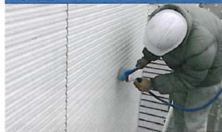
食器洗い用洗剤などを用いて、柔らかい布やブラシで洗浄し、その後流水で十分に洗い流します。