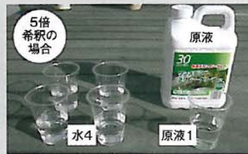
▲専用クリーナーと水