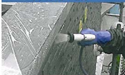
流水で十分に洗い流します。