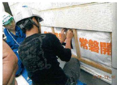
窯業系サイディングはがし検査